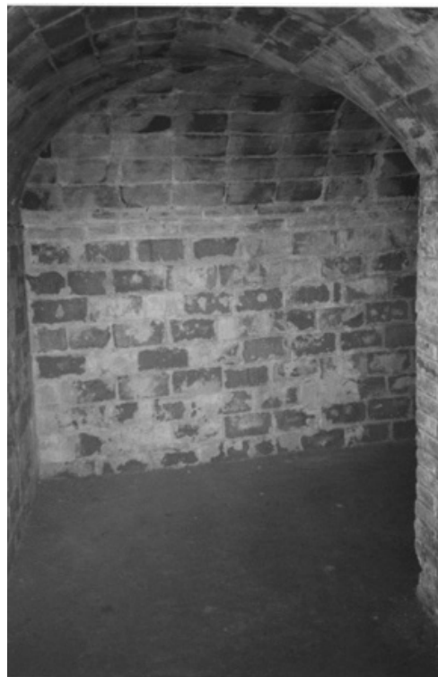
Fotografía 10. Interior del refugio de la calle Cornudella, en el barrio de Can Peguera.

advertir a los bombarderos. En muchas ocasiones los aviones italianos sobrevolaban el barrio surgiendo por sorpresa desde la espalda de la sierra de Collserola en su camino hacia la parte baja de la ciudad. Fue el temor a estos vuelos lo que debió impulsar a los vecinos de Can Peguera y de otros núcleos de población cercanos a construir refugios. No obstante, la iniciativa resultó acertada ya que en esta zona de la ciudad tampoco se libraron de las bombas. 39